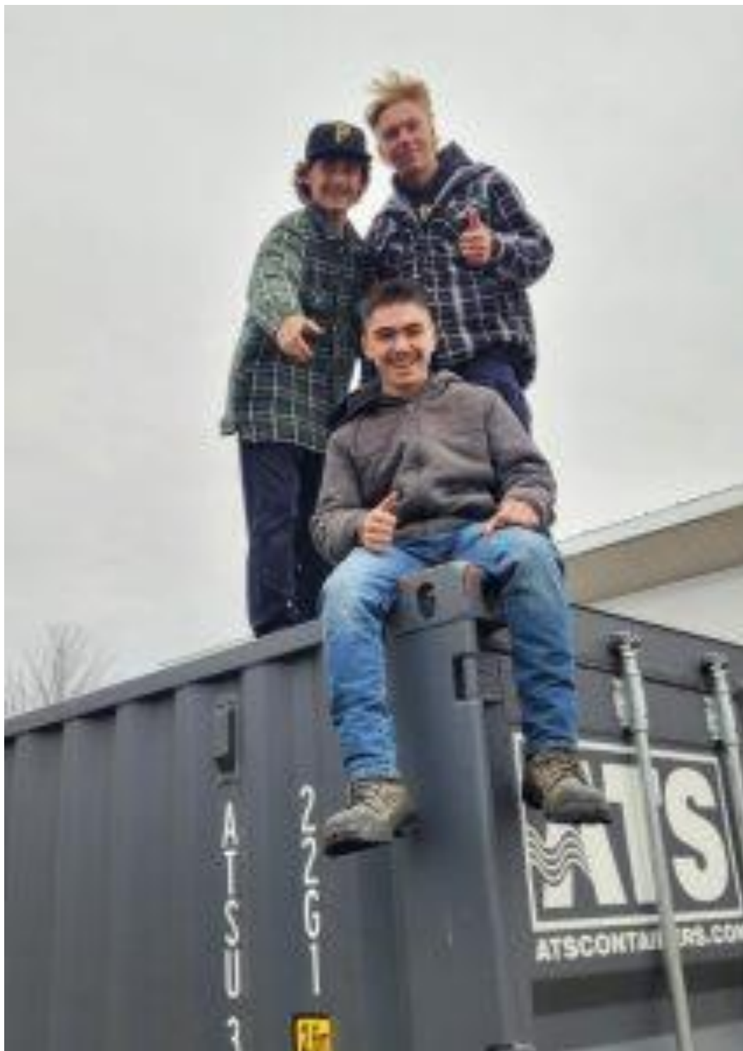
Des élèves posent fièrement sur le conteneur.