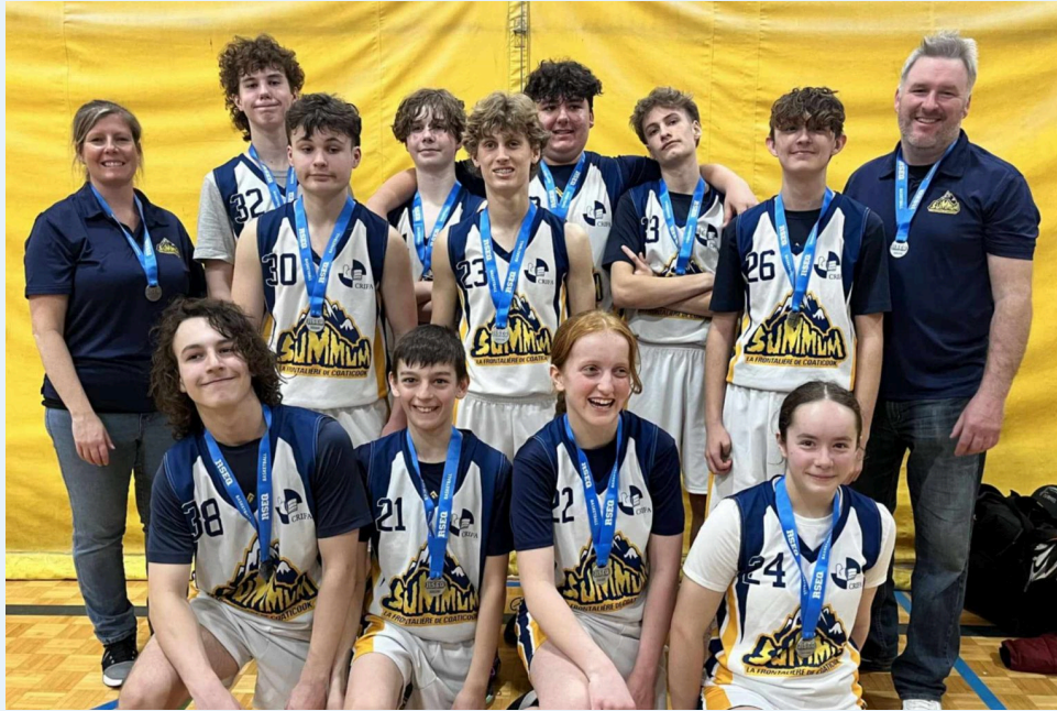
L'équipe de basketball «Cadet D4 - Niveau 1» du Summum a bien fait lors des championnats régionaux.