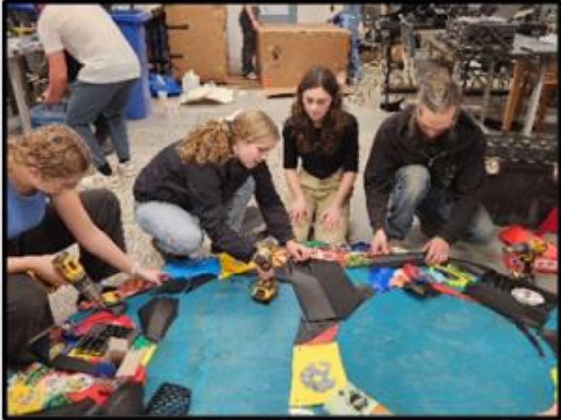
Les élèves en pleine séance de création artistique.