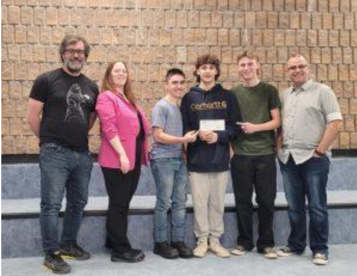
Plusieurs fondations, organisation et entreprises soutiennent les projets du programme Éco Plein-air de l'école secondaire de l'Odysée.