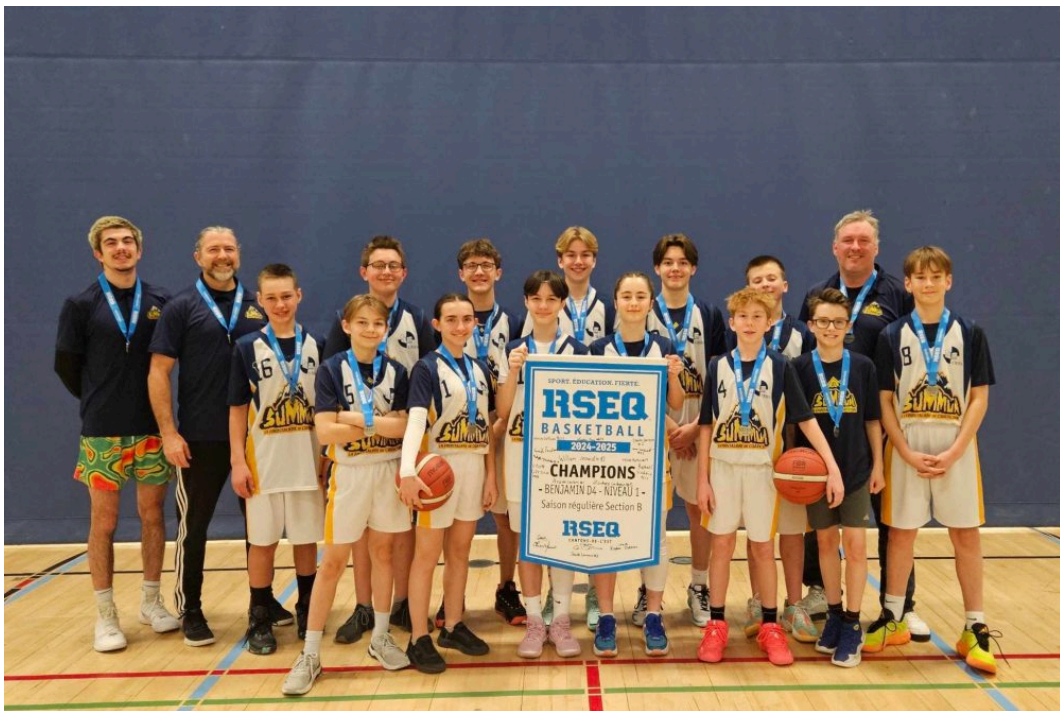
L'équipe de basketball du Summum «Benjamin D4 - Niveau 1» sont champions de la saison régulière.