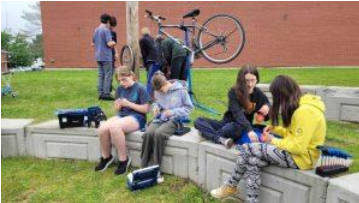
En attendant l'aménagement de l'atelier dans le conteneur, les élèves réparent leurs vélos dehors.

Lurlu & Cie offrira ces ateliers de mécanique dans le conteneur.