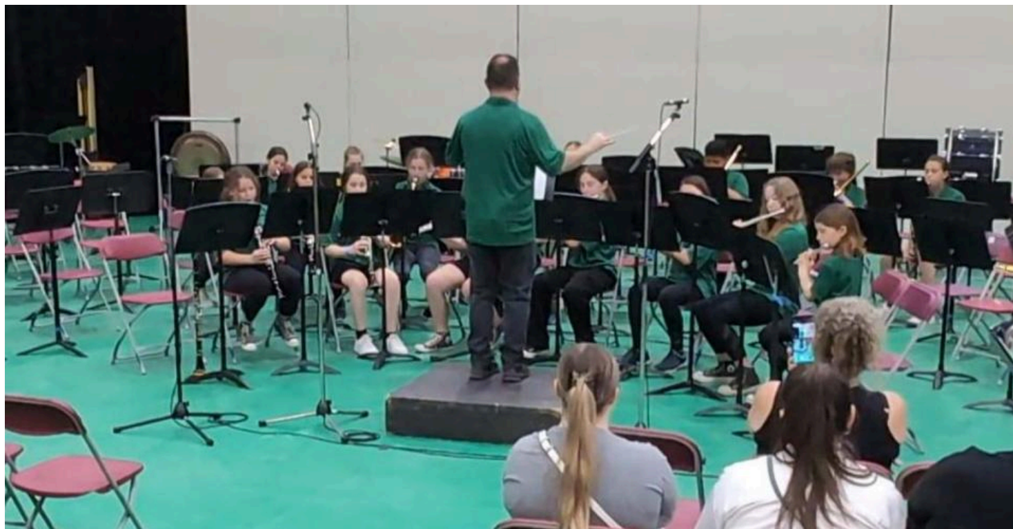
L'Harmonie de l'école Brassard/Saint-Patrice

Pierre-Olivier Girard p-ogirard@lerefletdulac.com