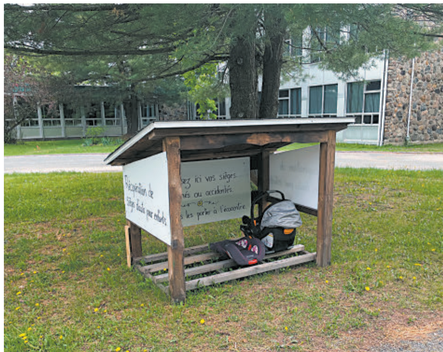
Les gens peuvent déposer leurs vieux sièges d'auto pour enfants dans un abri situé devant l'école Plein-Cœur à Richmond.

L'école primaire Plein-Cœur est située au 555, 7e Avenue, à Richmond.